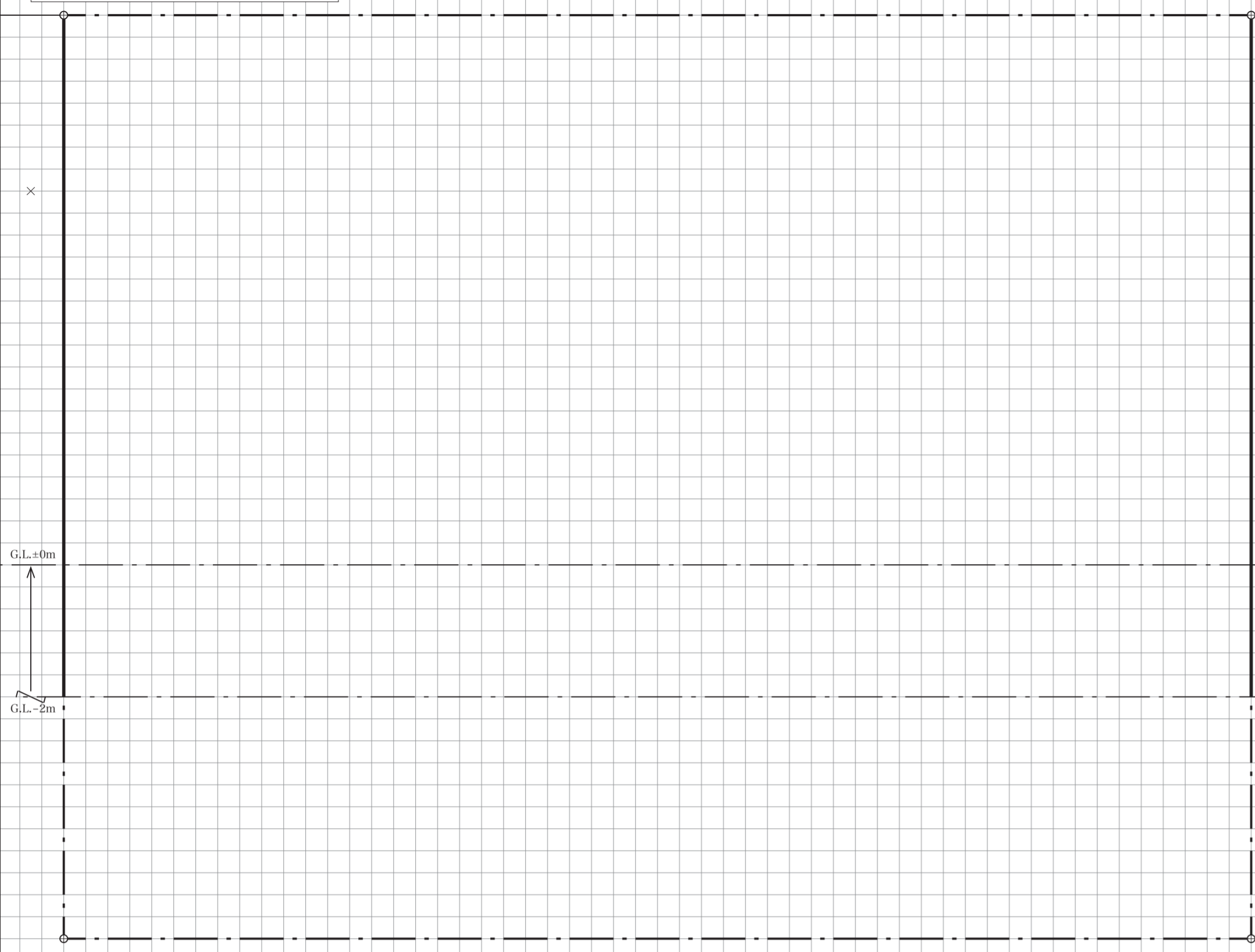
2階平面図 縮尺 1/200